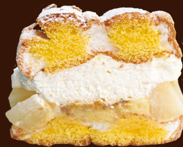
洋梨と栗のカルディナル 500円 (税込)